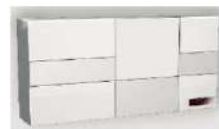
centralina a 3 canali cod.MISTA

PER LA PREDISPOSIZIONE IMPIANTO VEDI SCHEDA PREDISPOSIZIONE ELETTRICA PER FINESTRE (sezione pdf tecnici su ns.sito www.axelpoint.com )